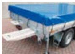
Bâche plate ou haute