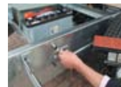
Prise de recharge extérieur (standard pour benne électrique)