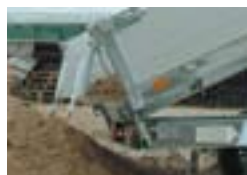
Porte arrière pivotante et ridelles rehaussées