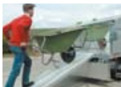
Rampes intégrées en aluminium