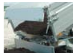
Jeu de ridelles suppl.