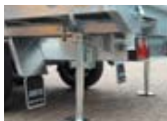
Béquilles réglables avec manivelle