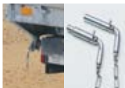
Tri-bennes avec sécurité de déformation de châssis