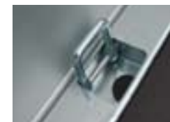
Points de fixation standard