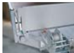
Treuil avec panneau avant amovible