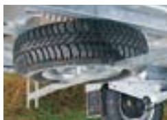
Roue de secours et support roue de secours