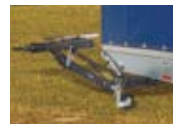
Timon réglable & oeillet DIN