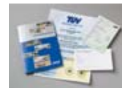
Garantie détaillée/ Saris, certifié ISO9001:2000