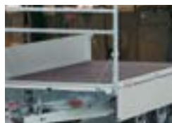
Panneau avant rabattable ou amovible