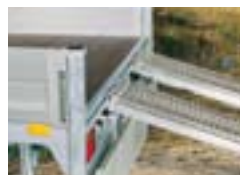
Rampes intégrées en aluminium