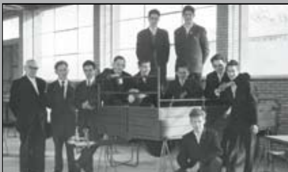
Depuis 1959, une fabrication en série de remorques.