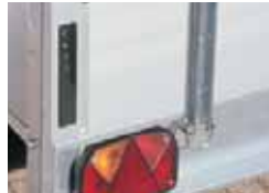
Belles fermetures de sécurité intégrées