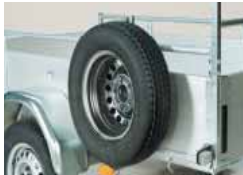
Roue de secours avec support