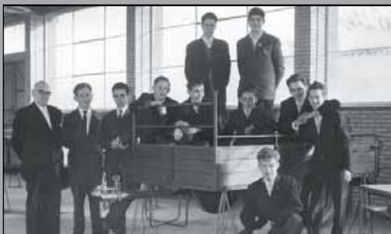
Depuis 1959, une fabrication en série de remorques.