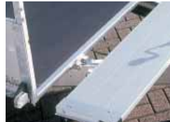
Hayon avant rabattable