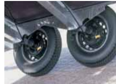
Berceau d'essieu large