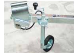
Serrure de sécurité/roue jockey