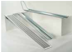
Rampe d'accès en aluminium, rampe d'accès et rampe de fixation en acier