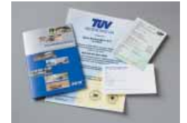
Garantie détaillée/Saris, certifié ISO9001:2000