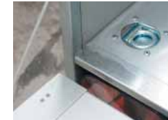
Oeillets d'arrimage/plancher revêtu d'une plaque aluminium ou acier