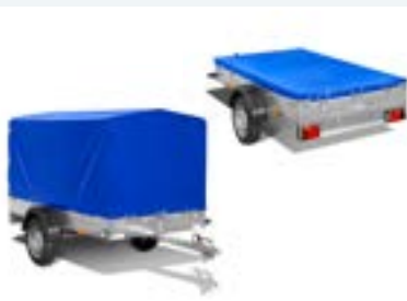
HUIF OF VLAKZEIL