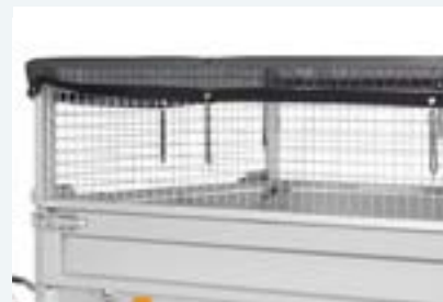
LOOFREK MET LOOFREKNET